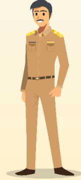
คณะกรรมการสาธารณสุขจังหวัด